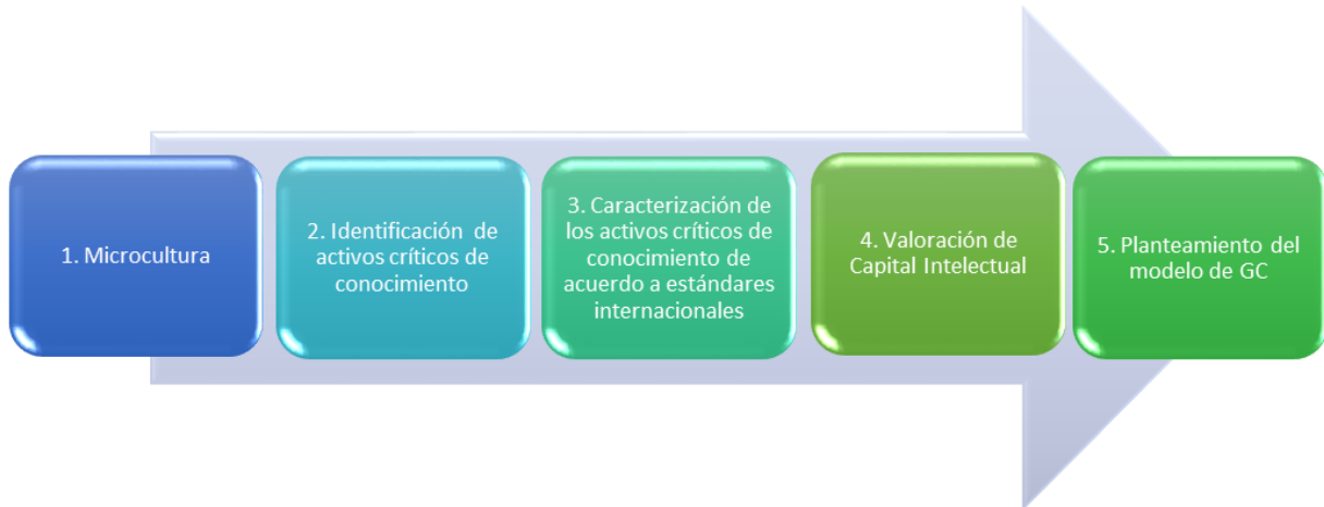
Figura 2. Proceso a seguir en la metodología (Elaboración propia)